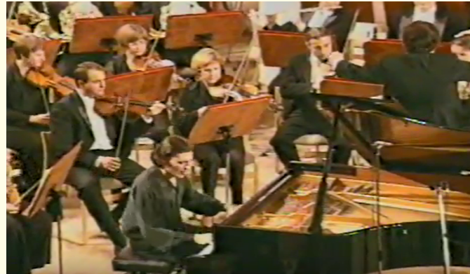
L'orchestre et le soliste improvisent ensemble