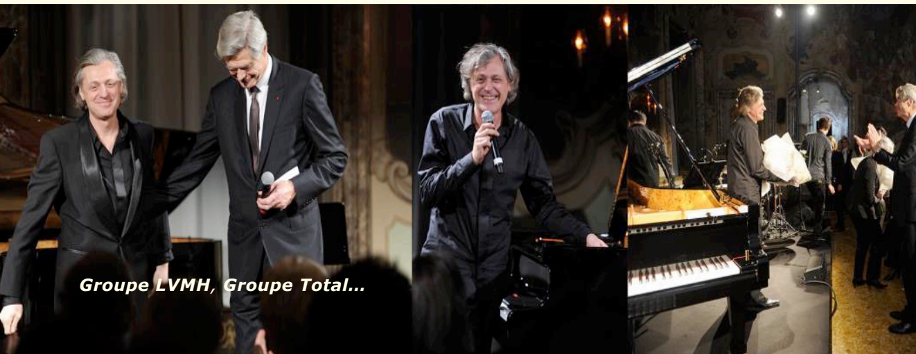
Groupe LVMH, Groupe Total...