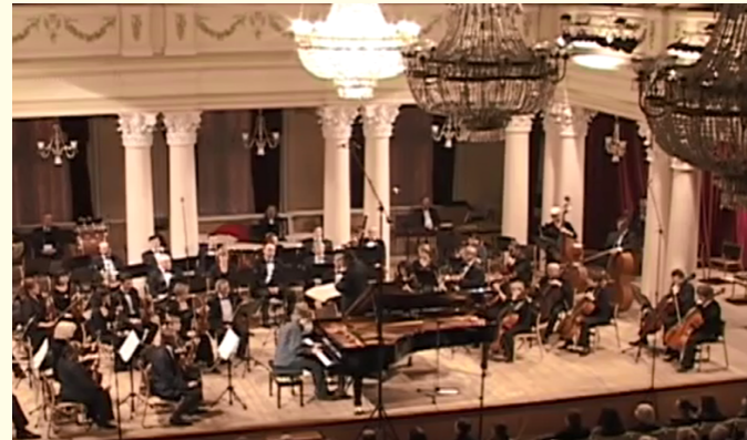
FINAL Interprété par l'orchestre et le soliste